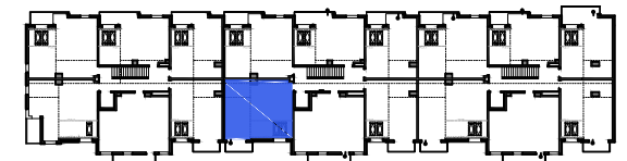
Usytuowanie mieszkania na rzucie kondygnacji