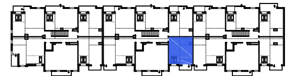
Usytuowanie mieszkania na rzucie kondygnacji

*Powierzchnia liczona zgodnie z Rozporządzeniem Ministra Transportu, Budownictwa i Gospodarki Morskiej z dnia 25 kwietnia 2012 r. w sprawie szczegółowego zakresu i formy projektu budowlanego oraz normą PN-ISO 9836:1997. Do powierzchni użytkowej lokalu wliczone są powierzchnie pod ściankami działowymi nadającymi się do demontażu/wyburzenia. Powierzchnie poszczególnych pomieszczeń mają charakter informacyjny.