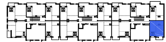
Usytuowanie mieszkania na rzucie kondygnacji

*Powierzchnia liczona zgodnie z Rozporządzeniem Ministra Transportu, Budownictwa i Gospodarki Morskiej z dnia 25 kwietnia 2012 r. w sprawie szczegółowego zakresu i formy projektu budowlanego oraz normą PN-ISO 9836:1997. Do powierzchni użytkowej lokalu wliczone są powierzchnie pod ściankami działowymi nadającymi się do demontażu/wyburzenia. Powierzchnie poszczególnych pomieszczeń mają charakter informacyjny.