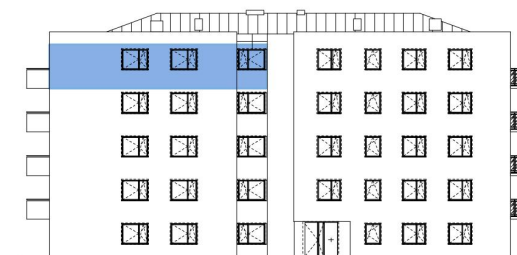
Usytuowanie mieszkania na elewacji.

*Powierzchnia liczona zgodnie z Rozporządzeniem Ministra Transportu, Budownictwa i Gospodarki Morskiej z dnia 25 kwietnia 2012 r. w sprawie szczegółowego zakresu i formy projektu budowlanego oraz obowiązującą normą PN-ISO 9836:1997. Do powierzchni użytkowej lokalu wliczone są powierzchnie pod ściankami działowymi nadającymi się do demontażu/wyburzenia. Powierzchnie poszczególnych pomieszczeń mają charakter informacyjny.