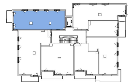
Usytuowanie mieszkania na rzucie kondygnacji.

Pow. użytkowa* 64,90m 2 Pow. balkonu ok. 4,30m 2