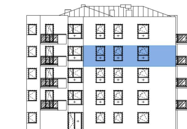
Usytuowanie mieszkania na elewacji.

*Powierzchnia liczona zgodnie z Rozporządzeniem Ministra Transportu, Budownictwa i Gospodarki Morskiej z dnia 25 kwietnia 2012 r. w sprawie szczegółowego zakresu i formy projektu budowlanego oraz obowiązującą normą PN-ISO 9836:1997. Do powierzchni użytkowej lokalu wliczone są powierzchnie pod ściankami działowymi nadającymi się do demontażu/wyburzenia. Powierzchnie poszczególnych pomieszczeń mają charakter informacyjny.