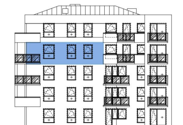
Usytuowanie mieszkania na elewacji.

*Powierzchnia liczona zgodnie z Rozporządzeniem Ministra Transportu, Budownictwa i Gospodarki Morskiej z dnia 25 kwietnia 2012 r. w sprawie szczegółowego zakresu i formy projektu budowlanego oraz obowiązującą normą PN-ISO 9836:1997. Do powierzchni użytkowej lokalu wliczone są powierzchnie pod ściankami działowymi nadającymi się do demontażu/wyburzenia. Powierzchnie poszczególnych pomieszczeń mają charakter informacyjny.