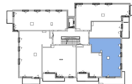
Usytuowanie mieszkania na rzucie kondygnacji.

Pow. użytkowa* 56,05m 2 Pow. balkonu ok. 11,20m 2