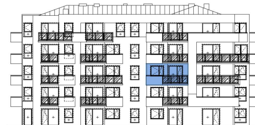
Usytuowanie mieszkania na elewacji.

*Powierzchnia liczona zgodnie z Rozporządzeniem Ministra Transportu, Budownictwa i Gospodarki Morskiej z dnia 25 kwietnia 2012 r. w sprawie szczegółowego zakresu i formy projektu budowlanego oraz obowiązującą normą PN-ISO 9836:1997. Do powierzchni użytkowej lokalu wliczone są powierzchnie pod ściankami działowymi nadającymi się do demontażu/wyburzenia. Powierzchnie poszczególnych pomieszczeń mają charakter informacyjny.