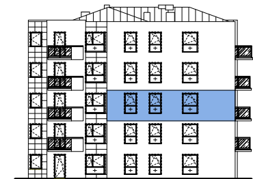
Usytuowanie mieszkania na elewacji.

*Powierzchnia liczona zgodnie z Rozporządzeniem Ministra Transportu, Budownictwa i Gospodarki Morskiej z dnia 25 kwietnia 2012 r. w sprawie szczegółowego zakresu i formy projektu budowlanego oraz obowiązującą normą PN-ISO 9836:1997. Do powierzchni użytkowej lokalu wliczone są powierzchnie pod ściankami działowymi nadającymi się do demontażu/wyburzenia. Powierzchnie poszczególnych pomieszczeń mają charakter informacyjny.