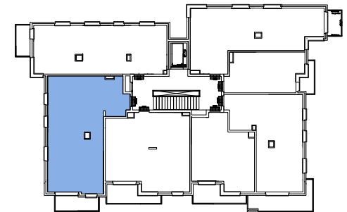
Usytuowanie mieszkania na rzucie kondygnacji.

Pow. użytkowa* 75,12m 2 Pow. balkonu ok. 6,30m 2