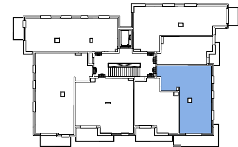
Usytuowanie mieszkania na rzucie kondygnacji.

Pow. użytkowa* 56,08m 2 Pow. balkonu ok. 11,20m 2