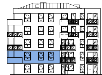
Usytuowanie mieszkania na elewacji.

*Powierzchnia liczona zgodnie z Rozporządzeniem Ministra Transportu, Budownictwa i Gospodarki Morskiej z dnia 25 kwietnia 2012 r. w sprawie szczegółowego zakresu i formy projektu budowlanego oraz obowiązującą normą PN-ISO 9836:1997. Do powierzchni użytkowej lokalu wliczone są powierzchnie pod ściankami działowymi nadającymi się do demontażu/wyburzenia. Powierzchnie poszczególnych pomieszczeń mają charakter informacyjny.